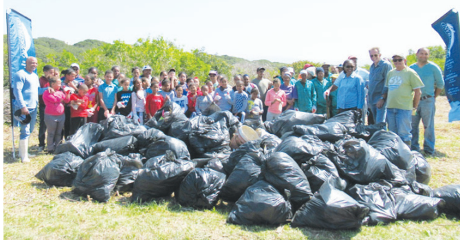
'n Uitsers verdienstelike klompie op die skouer vir almal wat gehelp het om Paddavlei en omstreke van hope en hope rommel te verlos

Njokwana en sy mede-koördineerders het nie minder nie as die grootste lof gehad vir die kadette se bereidwilligheid om moue op te rol en vir P.E.G. se inisiatief om hierdie opruimingsoperasie van stapel te stuur.